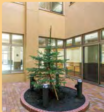
●俱有1階 レンガ敷きの光庭