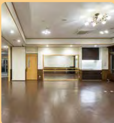
●コミュニティホールくゆう

介護施設の 新しいかたち 街と共存するという新しい 発想を軸に建設された 特別養護老人ホーム「俱有」。 利便性のある街に構える 当施設は「自分らしい生き方」や 「コミュニケーションのある生活」、 「心地よい空間」を考えた 新しいかたちを提案致します。