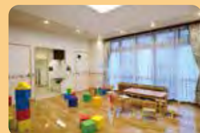
①事業所内保育所 遊戯室